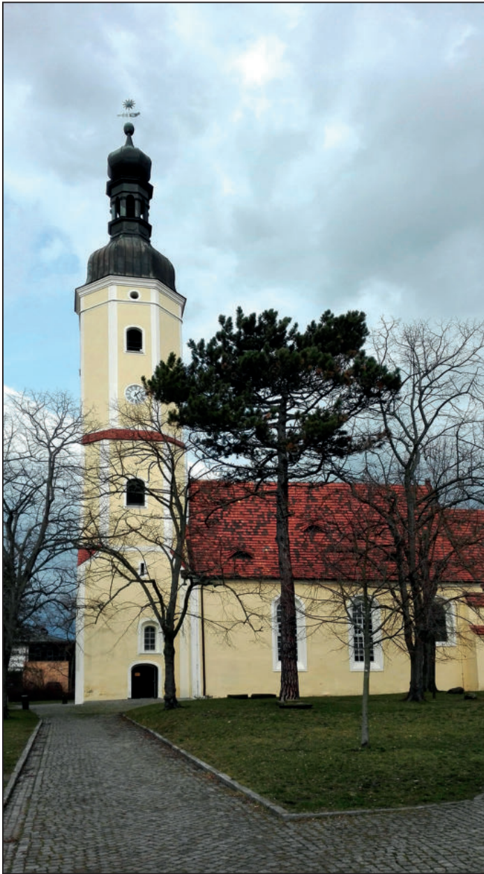
Nikolaikirche Bockwitz

Mit der Erneuerung der Nikolaikirche im nahegelegenen Bockwitz (heute Lauchhammer-Mitte) hat die Freifrau ein wichtiges Zeichen gesetzt und die Dankbarkeit dafür wurde ihr zu Ehren in Verse gefasst. 1720 erhielt der Kirchturm eine Höhe von 48 Meter und 1730 wurde eine neue Orgel eingebaut. Soziales Engagement lag ihr am Herzen. Sie setzte sich für den Schulunterricht und die Versorgung der Kranken und Alten ein. Die Freifrau war bei den Menschen im „Ländchen“ angesehen und respektiert und wurde liebevoll die „Mutter“ genannt.