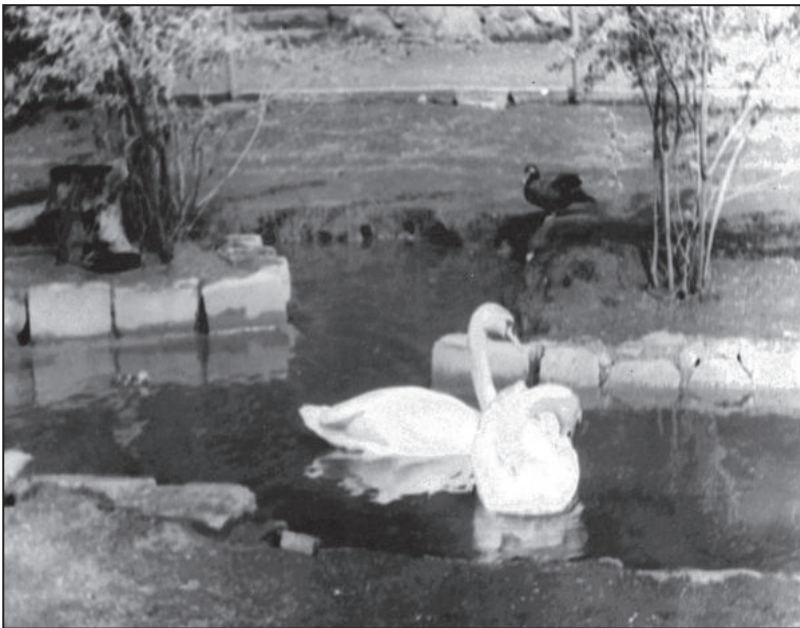
Wassergeflügelanlage in den 1930er Jahren.

Im Heimatbuch des Landkreises Calau aus dem Jahr 1937 findet man über den Tierpark Senftenberg folgenden Bericht des Lehrers Karl Göpfert aus Senftenberg (gekürzte Fassung):