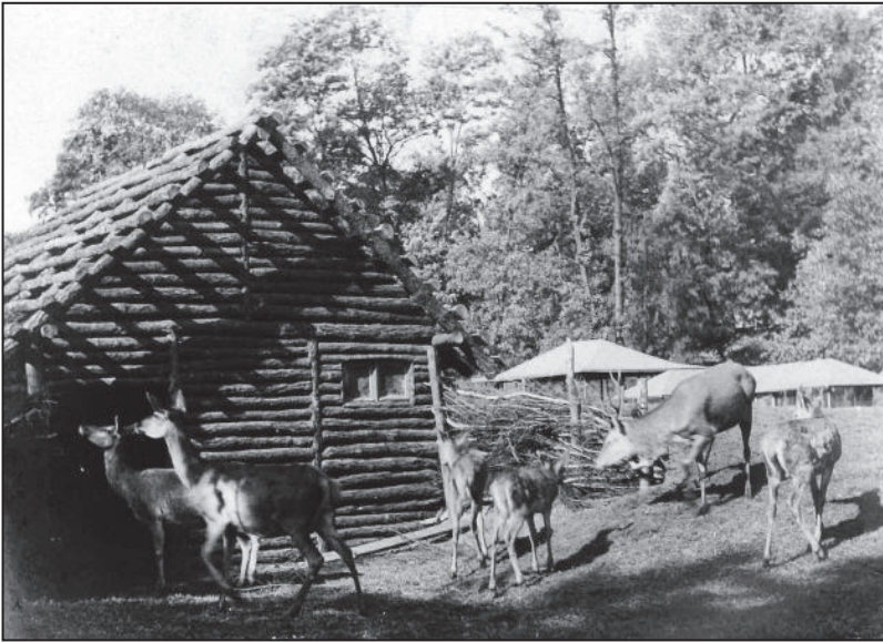
Rotwild, 1937.