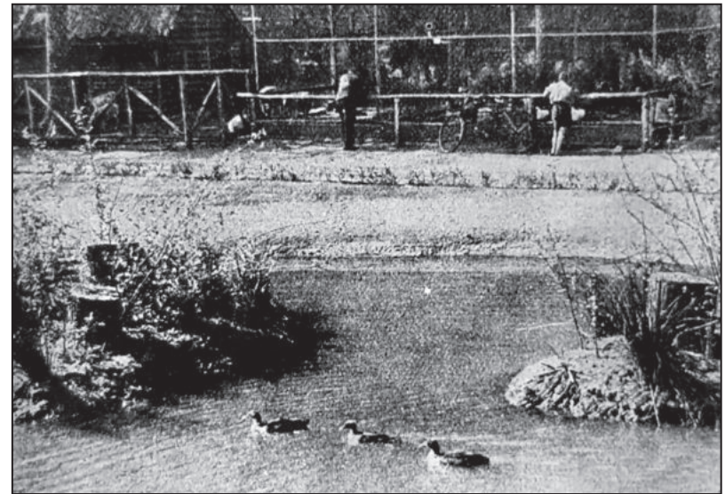
Wassergeflügelanlage 1937 – im Hintergrund das Ziergeflügelgehege.

Es liegt also noch manche Arbeit vor uns. Im Vertrauen auf den gesunden Sinn unserer Bevölkerung und die tatkräftige Unterstützung aller interessierten Kreise wird an der Verwirklichung der gesteckten Ziele weitergearbeitet - zum Nutzen für unsere Mitmenschen und zum Segen für unsere gefährdete Tierwelt.“